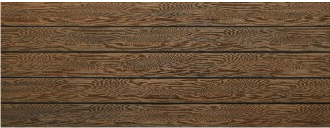
Thermoeiche (Optik) struktur