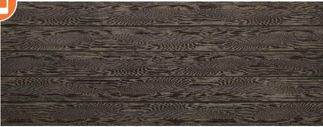
Thermoesche (Optik) struktur