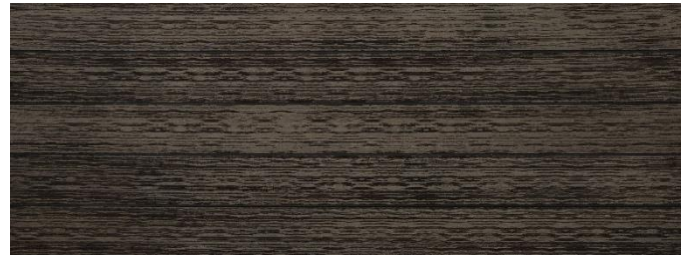
Thermoesche (Optik) gebürstet